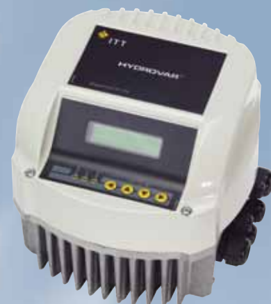
Contrôleur à vitesse variable monté sur moteur de pompe